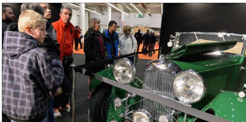
■ Le salon Auto Moto Rétro n'a pas désempli.

D'autant que les visiteurs sont parfois venus de loin, parfois bien au-delà des « frontières » de la Bourgogne Franche-Comté, pour non seulement admirer, mais aussi... acheter des véhicules d'exception. Pour Dijon Congrexpo, « grâce à l'appui de l'Automobile Club de Bourgogne,